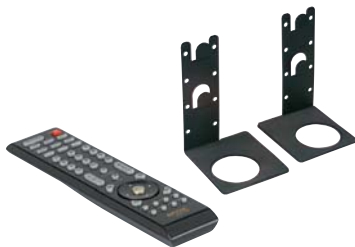
Mando a distancia para todas las funciones y montaje en pared

Dimensiones L x A x H en mm: 1065 x 220 x 130 (neto) 1210 x 285 x 210 (embalado)